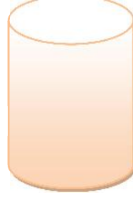
চেনি থকা পানী